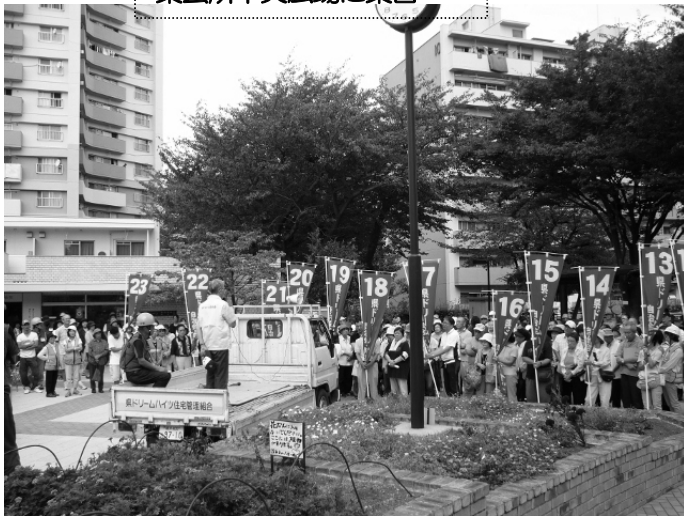
集会所中央広場に集合