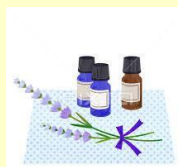
アロマとハーブティー