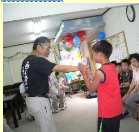
身を守るための護身術