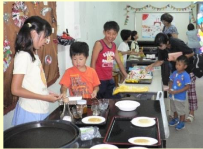
パンケーキ屋さん