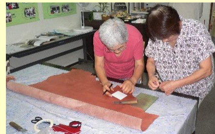
レーザークラフト