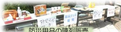
防災用品の陳列販売