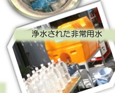
浄水された非常用水