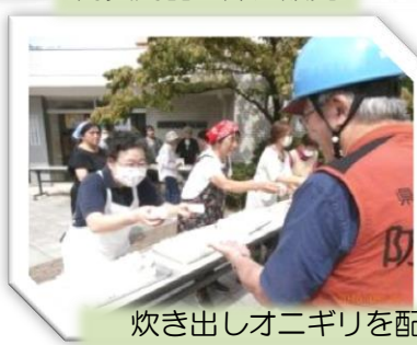
炊き出しオニギリを配布