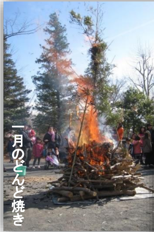
一月のどんと焼き