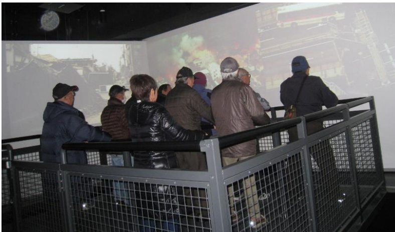
地震シミュレーター

火災シミュレーター —煙の中を避難する場面では、「甘い香りがしたね」「それは煙を吸っているということ、危ないですよ」と注意あり。