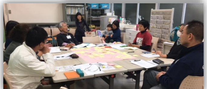
スタッフ会議では、安全・災害時対策なども議題にしています

緑の協会、日比谷花壇関連会社と共催し、スタッフはハイツ内の諸団体と有志です。不足しますのでお手伝いくださる方募集中です。