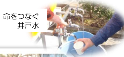
命をつなぐ 井戸水