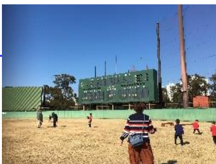
2020.2.8 俣野公園野球場での プレイパーク