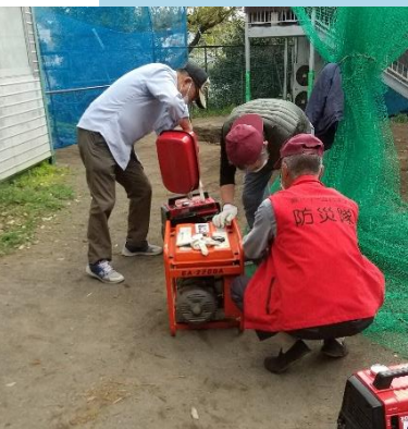
発電機(写真左)や浄化装置(写真右)を毎月動かして、常に作動するようにメンテナンスしています。