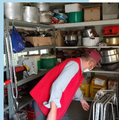
調理器具のストックを点検しています。