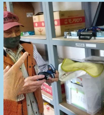
トランシーバーの保存状況、動作確認を毎月行なっています。