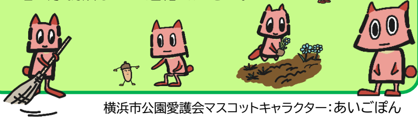
横浜市公園愛護会マスコットキャラクター:あいごぼん

10月は、あじさいとざる菊の手入れをします。ボランティア活動にご協力頂ける方は、自治会事務所までご連絡ください。