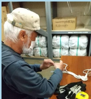
消防署の講習会のロープ訓練のために準備中です。