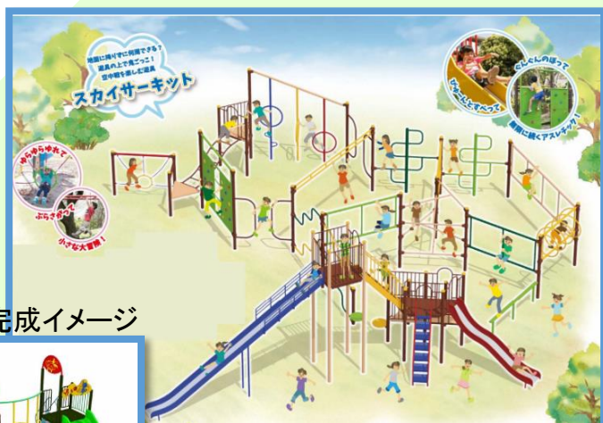
児童用複合遊具 完成イメージ