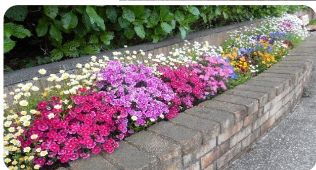
これから咲く紫陽花も楽しみです