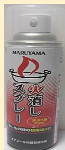
エアゾール式 簡易消火器